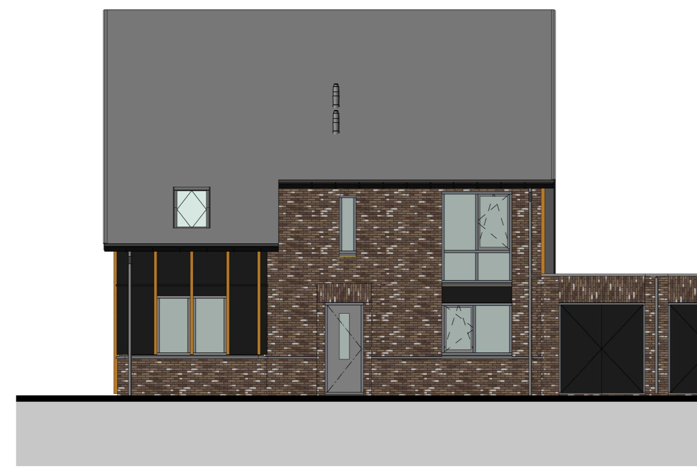
linkerzijgevel 1 : 100