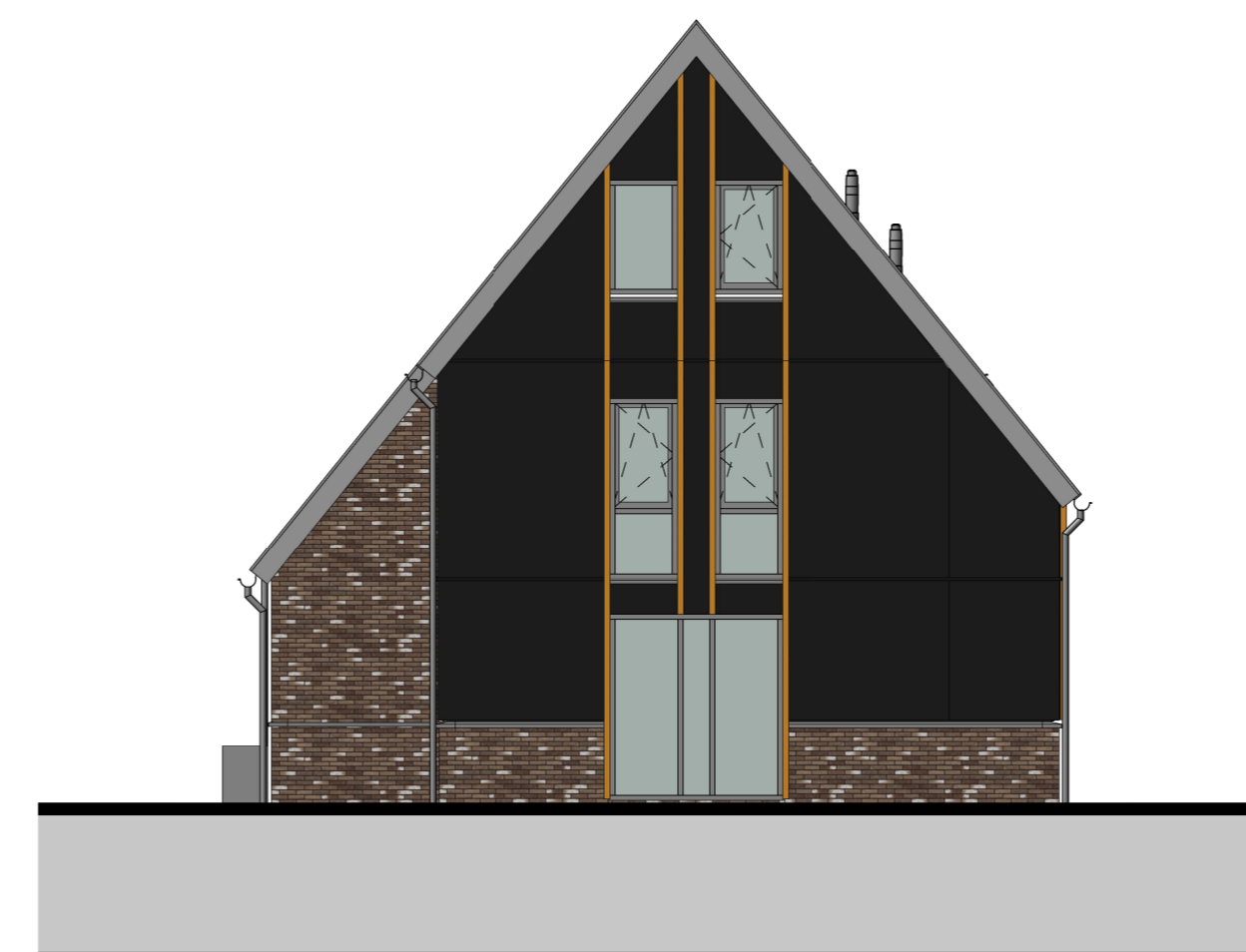
achtergevel 1 : 100