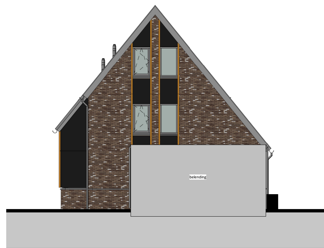
voorgevel 1 : 100