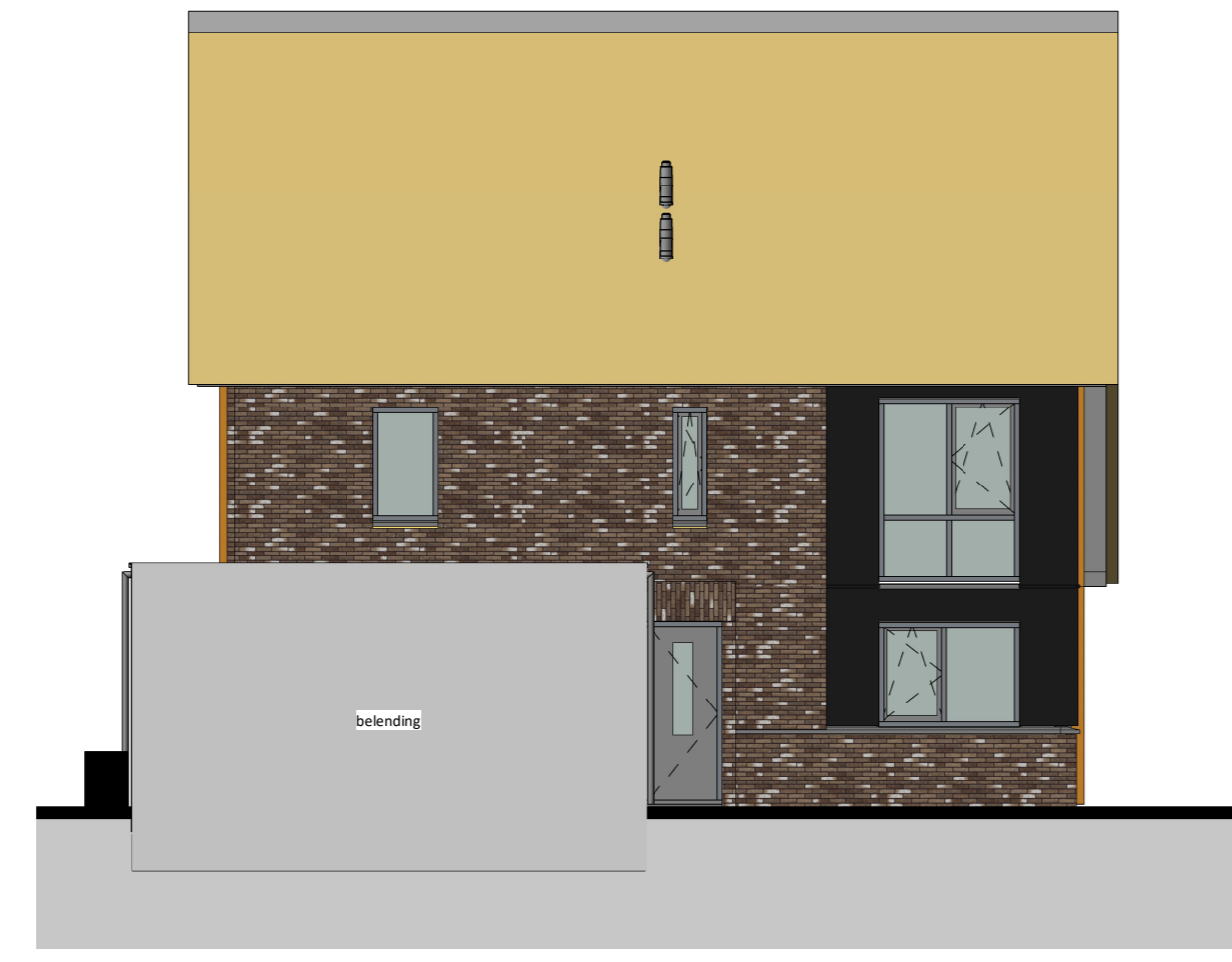
linkerzijgevel 1 : 100