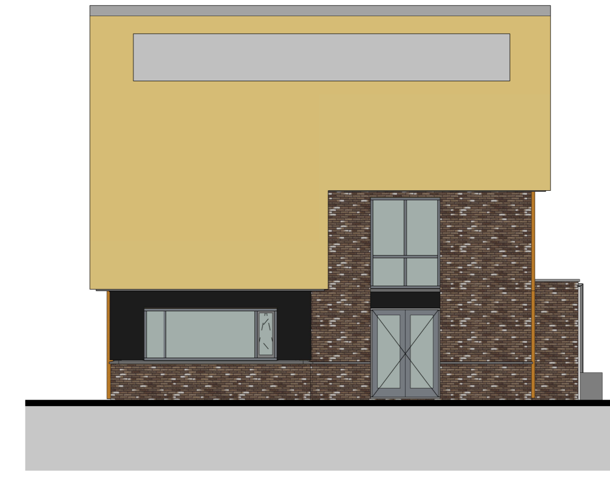
rechterzijgevel 1 : 100