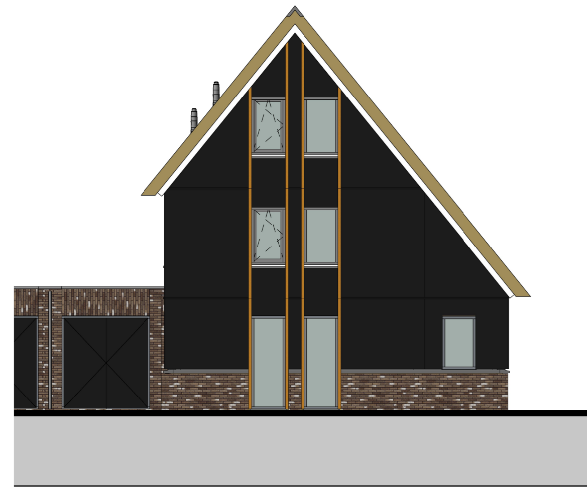
voorgevel 1 : 100