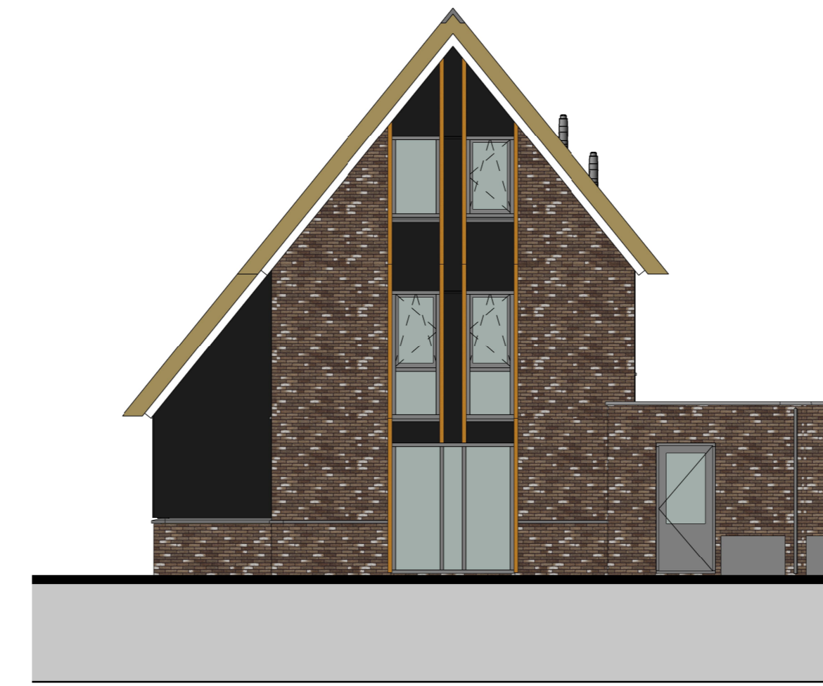
achtergevel 1 : 100