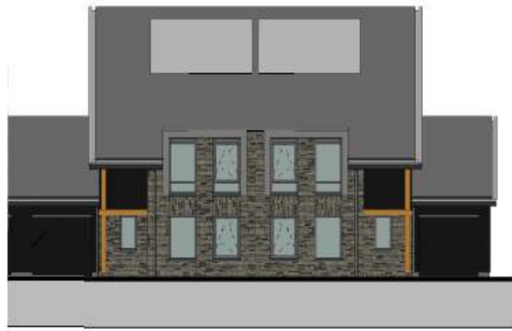
voorgevel 1 : 100