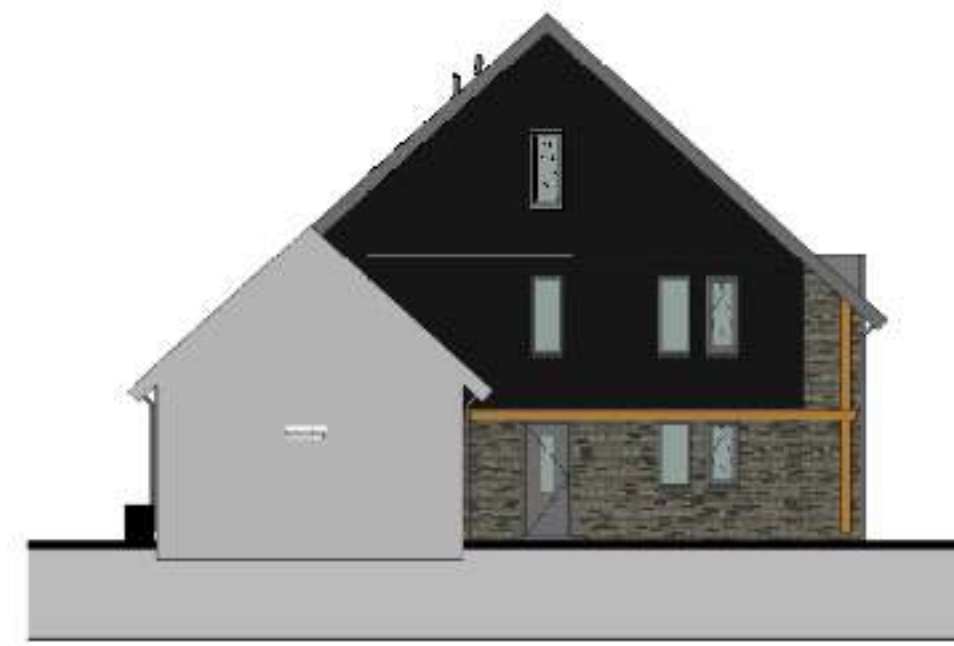
linkerzijgevel 1 : 100