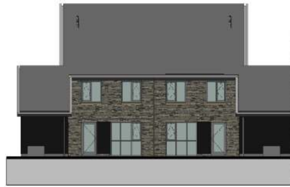
achtergevel 1 : 100