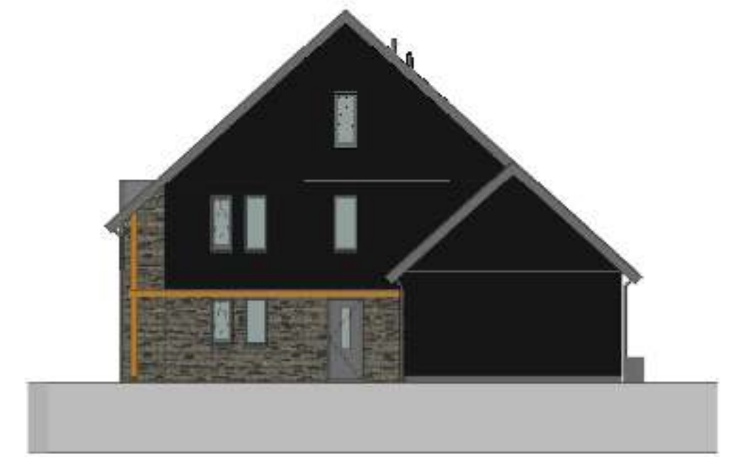
rechterzijgevel 1 : 100