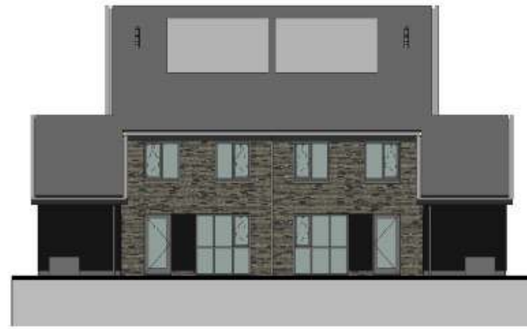
achtergevel 1 : 100