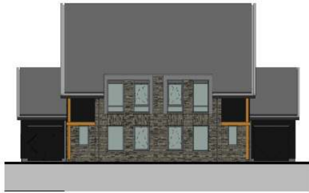
voorgevel 1 : 100