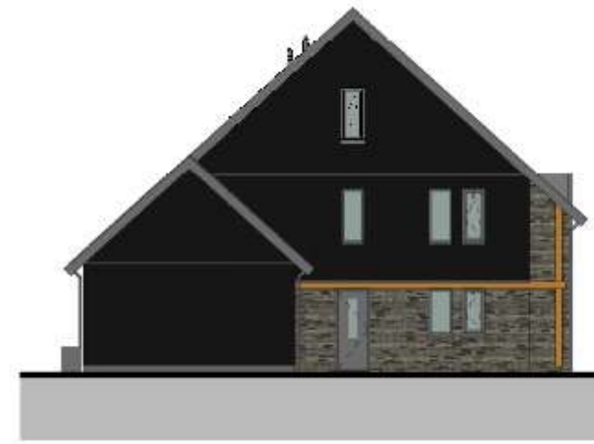
linkerzijgevel 1 : 100